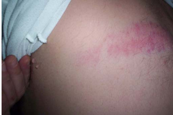
מר בכרי: סימני האלימות בגב