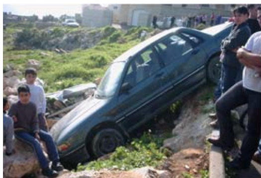
מכונית אחד התושבים שהושלכה לתהום ע"י המשטרה