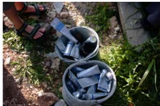
חלקים מרימוני הגז שנאספו על-ידי התושבים.