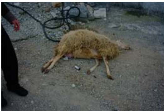
כבשה שמתה משאיפת גז