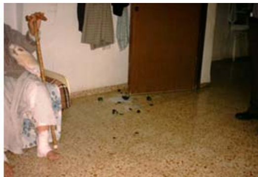
שרידים של רימון גז שהושלך לעבר אחד הבתים בכפר