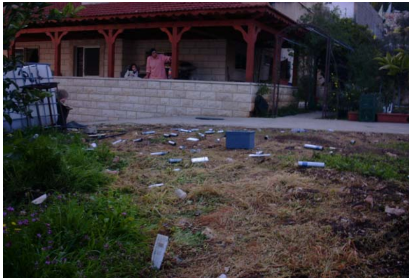
רימוני גז אשר הושלכו ליד בית מגורים