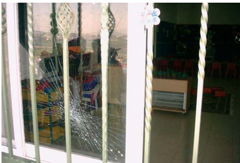
שמשת חלון הגן שנופצה על-ידי השוטרים