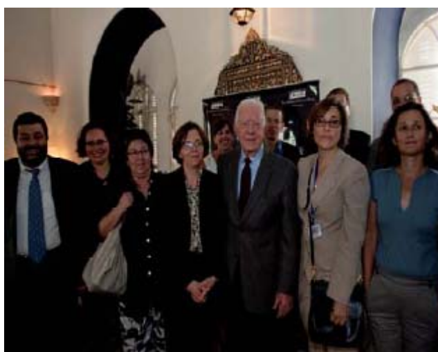
פגישה של ראשי ארגוני זכויות אדם עם נשיא ארצות הברית לשעבר, ג'ימי קרטר, בירושלים ביוני 2009