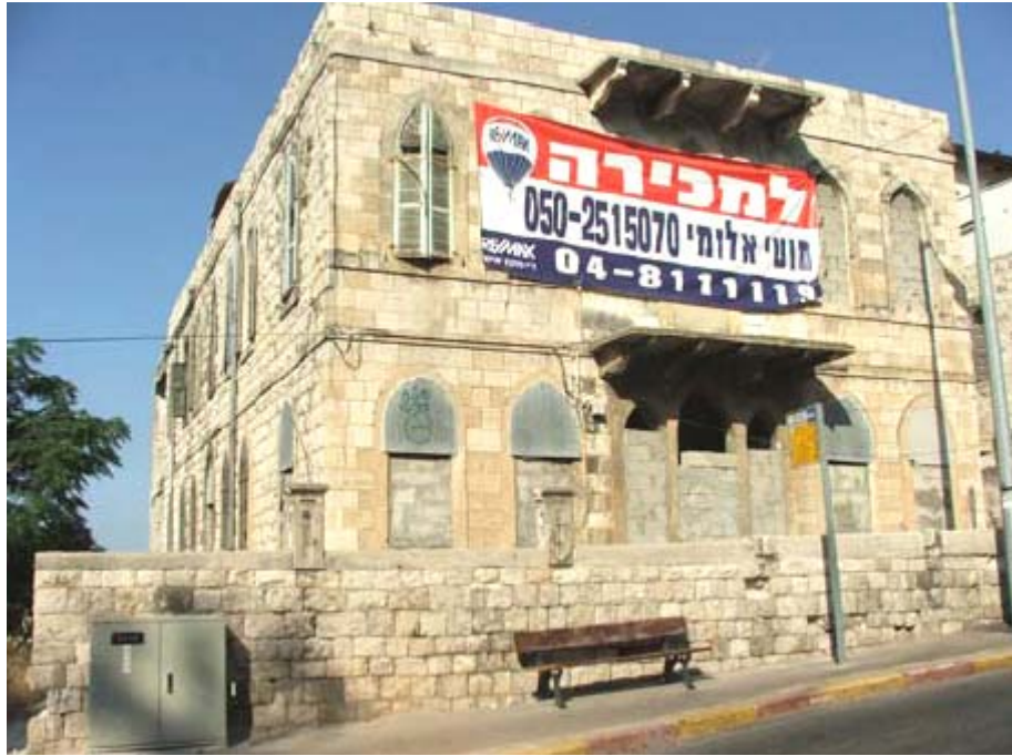
רכוש נפקדים מוצע למכירה בשוק החופשי

ב-2009 השיק עדאלה פרויקט חדש, הנוגע לזכויות הקניין של פליטים פלסטינים. במאי 2009 שלח עדאלה מכתב ליועץ המשפטי לממשלה, בדרישה לבטל מכרזים שפירסם מינהל מקרקעי ישראל למכירת נכסים השייכים לפליטים פלסטינים, הממוקמים בישראל. מ-2007 עד יוני 2009 פירסם מינהל מקרקעי ישראל 300 מכרזים למכירת רכוש "נפקדים" בנצרת, חיפה, לוד, עכו, ראש פינה ובית שאן.