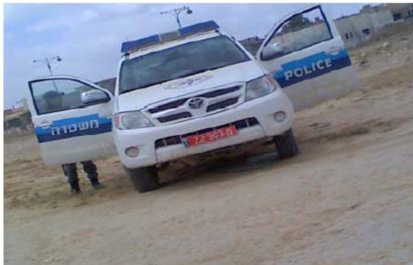
מחסום משטרה בכניסה לתרבין אל-סאנע, מאי 2009

מכתב שנשלח ליועץ המשפטי ביוני 2009, בדרישה לנקוט צעדים נגד שני יישובים קהילתיים במועצה האזורית משגב. שני היישובים שינו את התקנון שלהם, באופן שדורש מתושביהם להצהיר בכתב כי הם מאמינים בערכי הציונות, חוגגים חגים יהודיים ותומכים בהתיישבות בארץ ישראל.