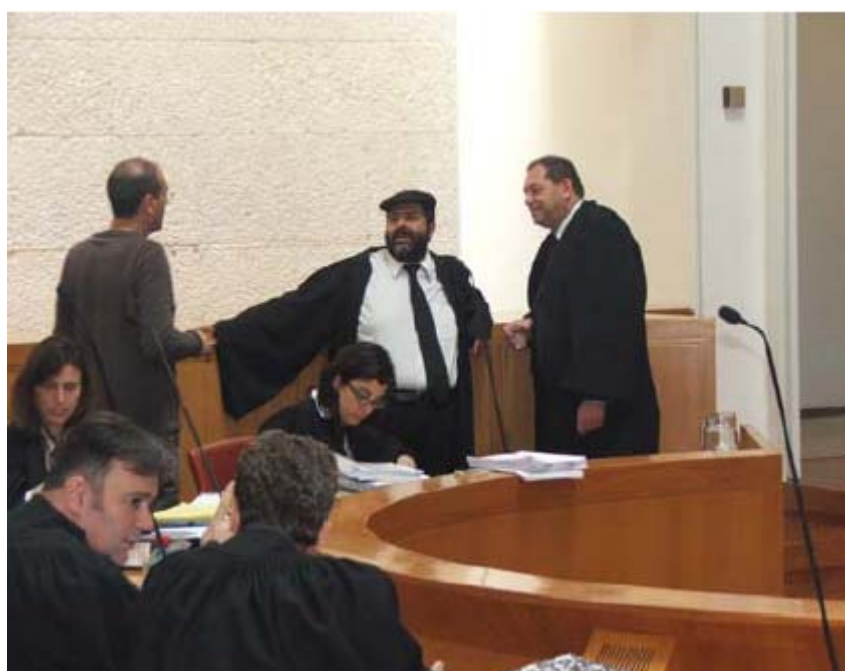
לפני הדיון בבג"ץ בעתירה נגד חוק האזרחות, מרס 2009

בג"ץ בהרכב מורחב של שבעה שופטים דן במרס 2009 בעתירה של עדאלה נגד תיקונים חדשים לחוק האזרחות והכניסה לישראל (הוראת שעה), התשס"ג-2003, שהרחיב את האיסור על איחוד משפחות בין פלסטינים אזרחי ישראל ופלסטינים מהשטחים גם לבני זוג מ"מדינות אויב" – לבנון, סוריה, איראן ועיראק. עם הטיעונים המסכמים הגיש עדאלה לבית המשפט שלוש חוות דעת של מומחים מ-Open Society Justice Initiative ומשפטנים מדרום אפריקה ומבריטניה. התיק תלוי ועומד לפני פסק דין סופי. http://www.adalah.org/heb/pressreleases.php?pr=09_03_16