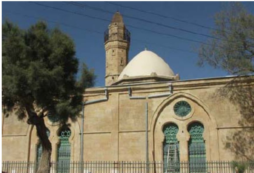
המסגד הגדול בבאר שבע, יוני 2009

http://www.adalah.org/heb/pressreleases.php?pr=09_06_16