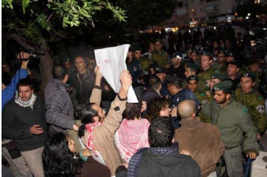
הפגנה נגד מבצע "עופרת יצוקה" בתל אביב, ינואר 2009

עדאלה גם ייצג בבתי המשפט 15 עצירים שנעצרו לאחר שהשתתפו בהפגנות נגד המלחמה בלבנון ב-2006 ונגד ההתקפות בעזה בתחילת 2009. בכל המקרים טען עדאלה, שהמשטרה עצרה את המפגינים בניגוד לחוק, מסיבות פוליטיות. כמה מהעצירים סבלו מפציעות קשות בעת מעצרו. פרטי התיקים האלה חסויים.