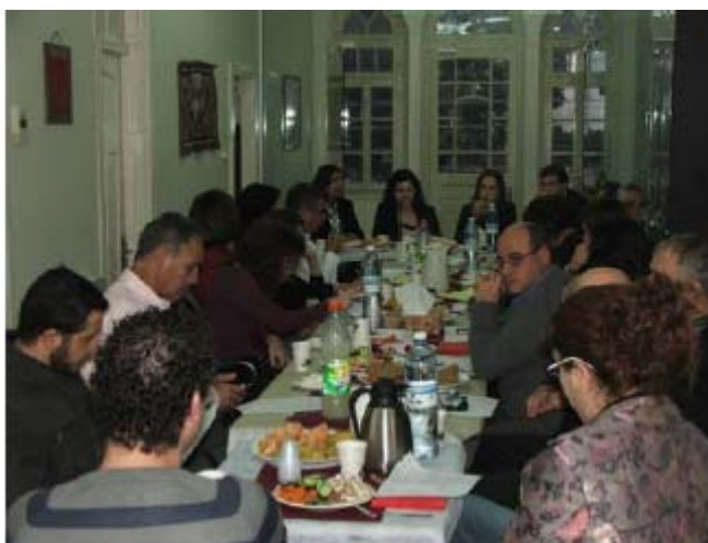
משתתפי השולחן העגול במשרדי עדאלה, פברואר 2009