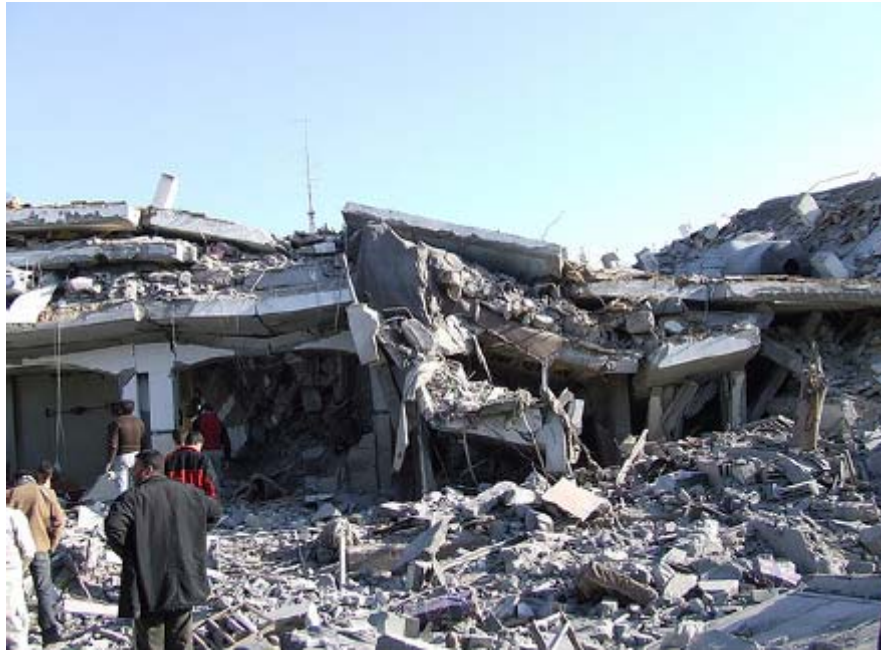
בית בעזה שנהרס לחלוטין במבצע "עופרת יצוקה" בינואר 2009

ב-27 בדצמבר 2008 פתח הצבא הישראלי במתקפה על רצועת עזה, שנמשכה עד 18 בינואר 2009. סוכנויות סיוע של האו"ם וארגונים פלסטיניים בזה דיווחו כי בשלושת השבועות של ההתקפה (מבצע "עופרת יצוקה") נהרגו לפחות 1,440 פלסטינים – ובהם 431 ילדים ו-114 נשים, למעלה מ-5,300 פלסטינים נפצעו ולמעלה מ-4,230 בתים נהרסו. ההרס שנגרם במבצע היה חסר תקדים, בעיקר בהתחשב במצור המוטל על עזה מאז 2007.