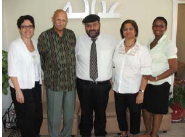
פגישה עם שגריר דרום אפריקה בישראל במשרדי עדאלה, יוני 2009

עדאלה אירח במשרדיו את שגריר דרום אפריקה בישראל, איסמעיל קובאדיה, ביוני 2009.