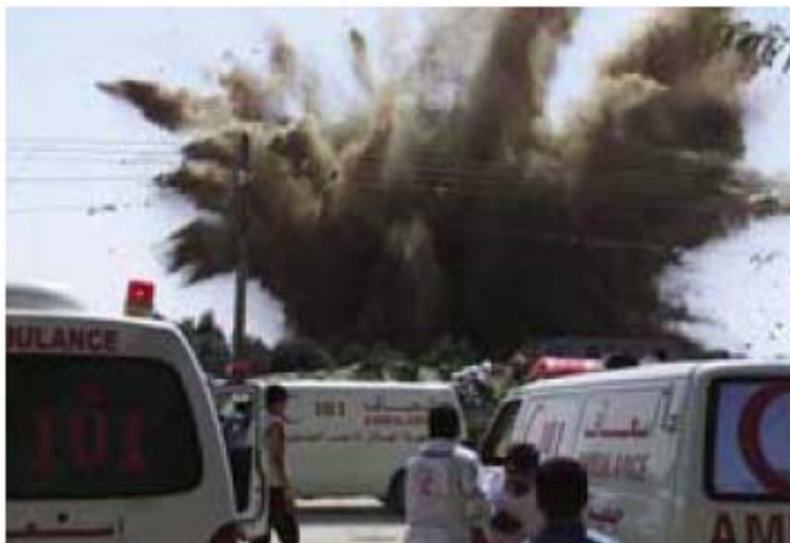
אמבולנסים שהופצצו בעזה במבצע "עופרת יצוקה"

http://www.adalah.org/newsletter/heb/jan09/9.php