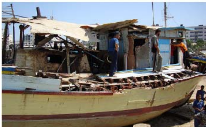
ספינה של דייגים עזתיים שהופגזה על ידי ספינה ישראלית בחוף עזה

http://www.adalah.org/features/gaza/journalist.doc