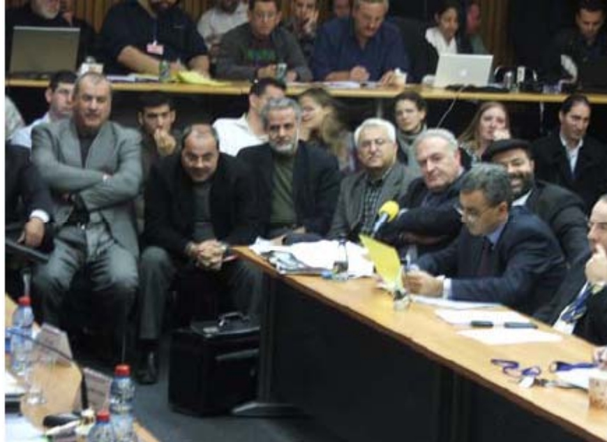
חברי כנסת ערבים ומנכ"ל עדאלה בדיון בוועדת הבחירות המרכזית, ינואר 2009

בינואר 2009, בשיאה של מערכת הבחירות לכנסת, הגישו חברי כנסת ממפלגות הימין לוועדת הבחירות המרכזית בקשות לפסול שתי מפלגות ערביות – ברית לאומית דמוקרטית (בל"ד) ורשימה ערבית מאוחדת-התנועה הערבית להתחדשות (רע"מ-תע"ל). אנשי הימין טענו כי שתי הרשימות עברו על סעיף 7א לחוק יסוד: הכנסת, ושב"ל"ד, הקוראת להקים "מדינת כל אזרחיה", שוללת את קיומה של ישראל כמדינה יהודית ודמוקרטית. כן נטען כי שתי הרשימות תומכות בארגוני טרור וב"מדינות אויב". עדאלה ייצג את בל"ד ורע"מ-תע"ל בוועדת הבחירות המרכזית וטען כי אין בסיס חוקי לפסילתן. ועדת הבחירות החליטה לפסול את המפלגות הערביות, בתמיכתן של שלוש המפלגות המרכזיות – קדימה, הליכוד והעבודה.