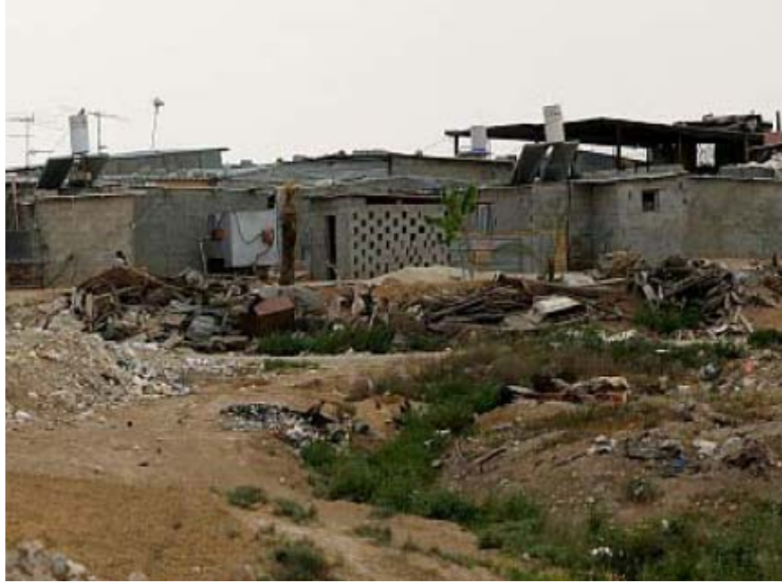
בית הרוס בכפר הערבי הבדווי הלא מוכר חי שאם זינא בנגב

דיון להצגת הוכחות התקיים בבית משפט השלום בבאר שבע במחצית הראשונה של 2009, בתביעות שהגיש עדאלה לבטל צווי פינוי שהוצאו נגד 1,000 תושבי הכפר הערבי הבדווי הלא מוכר עתיר-אום אל-חיראן ונגד צווי הריסה ל-33 בתים בכפר. דיונים להצגת הוכחות התקיימו גם במשפט שמנהל עדאלה נגד צווי הריסה שהוצאו לכל הבתים בכפר אל-סורה.