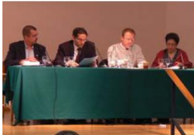
דיון לכבוד פרסום המחקר בלונדון, מאי 2009

http://www.hsrb.ac.za/Media_Release-378.phtml