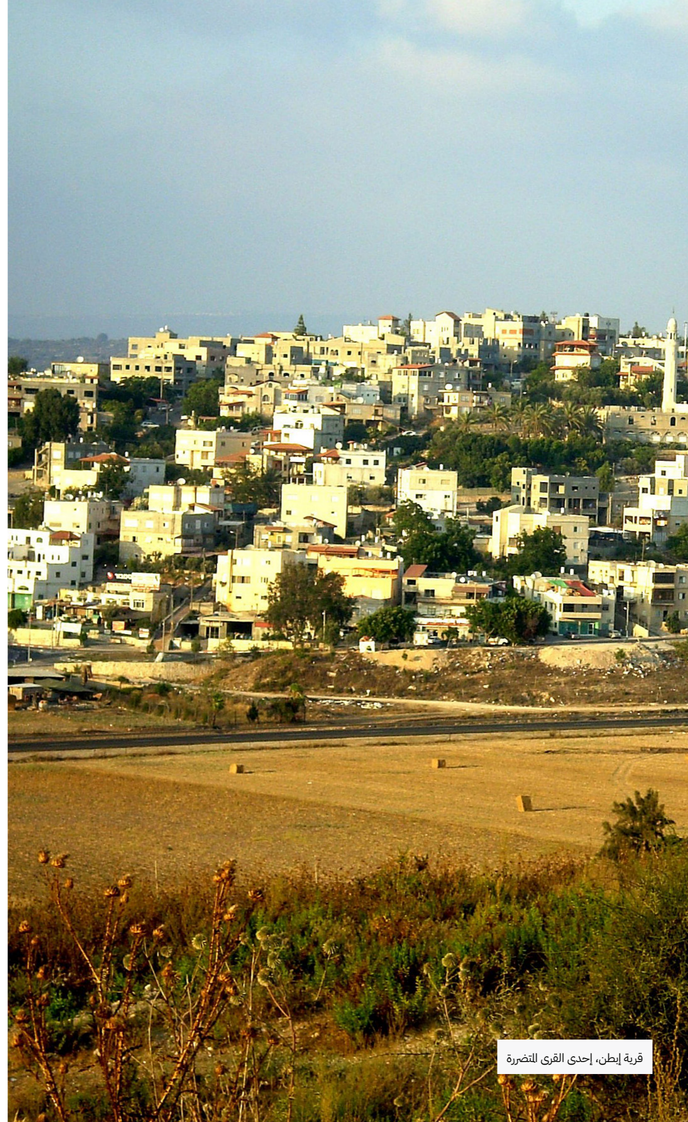
قرية إبطن، إحدى القرى المتضررة

في تموز 2023، تم تقليص نسبة كبيرة من المساحة المخصصة لمكب نفايات إسرائيلي مخطط له في القدس الشرقية المحتلة من حوالي 406 دونم إلى 100 دونم - معظمها أراضٍ فلسطينية بملكية خاصة - في أعقاب الاعتراضات التي قدمت ضد مشروع مكب النفايات، من بينها اعتراض قدمه مركز عدالة والاتلاف الأهلي لحقوق الفلسطينيين في القدس. بصيغتها الأصلية، كانت ستؤثر الخطة على حوالي 90 ألف فلسطيني مقدسي.