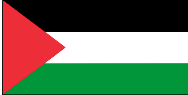
דגל פלסטין מ-2006

בשנת 1988 במסגרת הכרזת העצמאות הפלסטינית בכנס ה-19 של המועצה הלאומית הפלסטינית באלג'יר אושש מעמדו של הדגל הלאומי הפלסטיני כדגלה של המדינה הפלסטינית המוכרזת. לאחר החתימה על הסכמי אוסלו, הדגל אומץ על ידי הרשות הפלסטינית ובשנת 2006 נקבע תיאורו בחוק. החל מיום 30.09.2015, הדגל מונף במטה האומות המאוחדות בניו-יורק, וזאת לאחר שבשנת 2012 הוענק למדינת פלסטין מעמד של חברה משקיפה בארגון.