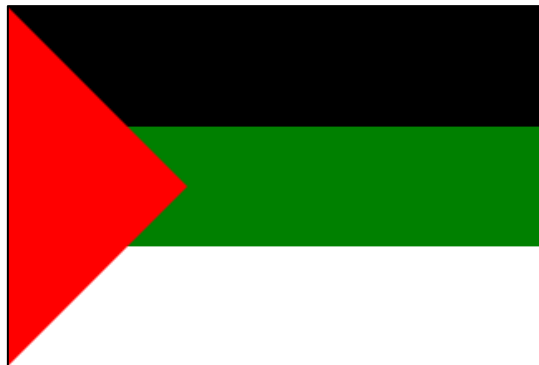
דגל ממשלת כל-פלסטין בעזה 1948

גם לאחר 1948, הדגל הפלסטיני המשיך לשמש את רשויות השלטון ברצועת עזה עד לכניסת כוחות הצבא המצריים. באותה שנה, נערך הכנס הלאומי בחודש אוקטובר, שבו נתקבלה ההחלטה להכריז על עצמאות פלסטין בגבולותיה המנדטוריים ואף הוחלט לאמץ את הדגל הערבי כדגל פלסטין. לאחר המהפכה המצרית בשנת 1952, חזר הדגל הפלסטיני לשמש לצד הדגל המצרי במוסדות החינוך ובאירועים חגיגיים ובשנת 1958 הדגל הונף לצד הדגל המצרי בעזה מעל כל המבנים הממשלתיים.