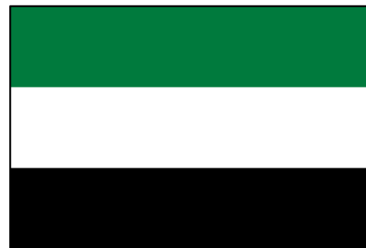
דגל תנועת אל-פתאח 1914

ואולם, חזון המדינה הערבית לא יצא לפועל על רקע התנגדותן הפעילה של בריטניה וצרפת שחילקו את שטחי הלבנט ביניהן. אף על פי כן, ובמהלך השנים שלאחר מכן, הדגל הפאן-ערבי, בין אם בגרסתו המקורית ובין אם בגרסאות מעודכנות, המשיך לשמש את העמים הערביים באזור. כך למשל, עם ההכרזה על עצמאות הממלכה הערבית קצרת הימים בסוריה, שגבולותיה חלשו על כלל חלקי הלבנט (סוריה, לבנון, עיראק, ירדן ופלסטין), אומץ הדגל הפאן-ערבי עם הוספת כוכב משובע הממוקם במשולש האדום. הפלסטינים עוד בשנת 1919 דרשו הקמת ממשלה פלסטינית עצמאית שתהיה חלק מהמדינה הסורית הגדולה באיחוד פדראלי. ההכרזה על עצמאות הממלכה הערבית בסוריה כשנה לאחר מכן, על כן, נתקבלה בחגיגות ברחוב הפלסטיני,