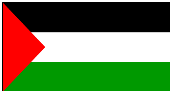
דגל פלסטין 1964-2006 (מימדי המשולש שונו ב-2006 על פי חוק)