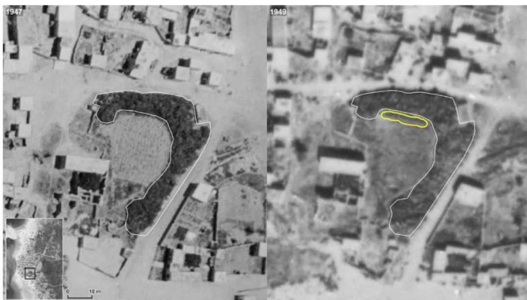
Figure 39. Comparison of the site of E2 between 1947 and 1949 marking the bush lines. Forensic Architecture, 2023.

א.2. קבר אחים שני- 2 Earth Feature (E2) : אורכו כ-19 מטר, ורוחבו 3 מטר, וגובהו כ-85 ס"מ. בהתאם לגודלו ועומקו, הקבר יכול להכיל בין 40-80 גופה.