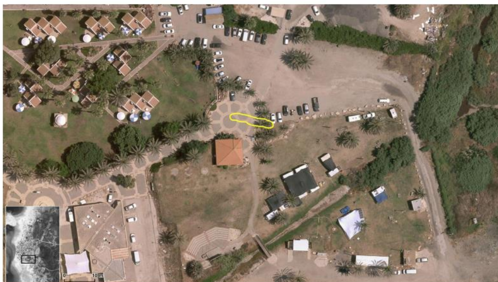
Figure 45. Boundary of Earthwork 2 marked within contemporary satellite image.

מרכז הקבר הינו בערך בנקודה 32.60918, 34.91803, וגבולותיו בנקודות: 32.60922, 34.91793. מיקום הקבר על גבי צילום אוויר 32.60918, 34.91813; 32.60916, 34.91812; 32.60919, 34.91793. עדכני מעלה כי הוא נמצא בתחילת דרך למעבר רגלי לחניון חוף המושב דור.