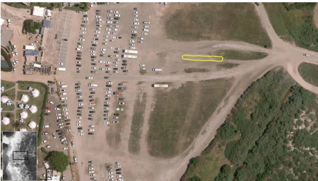
Figure 34. Boundary of Earthwork 1 marked within contemporary satellite image.

מרכז הקבר הוא בערך בנקודה 32.61089, 34.91905, וגבולותיו בנקודות : 32.61091, 34.91887; 32.61088, 34.91887; 32.61089, 34.91924; 32.61086, 34.91924. מיקום הקבר על גבי צילום אוויר עדכני מעלה כי הוא משמש כחלק מהחניון לחוף וכפר נופש דור.