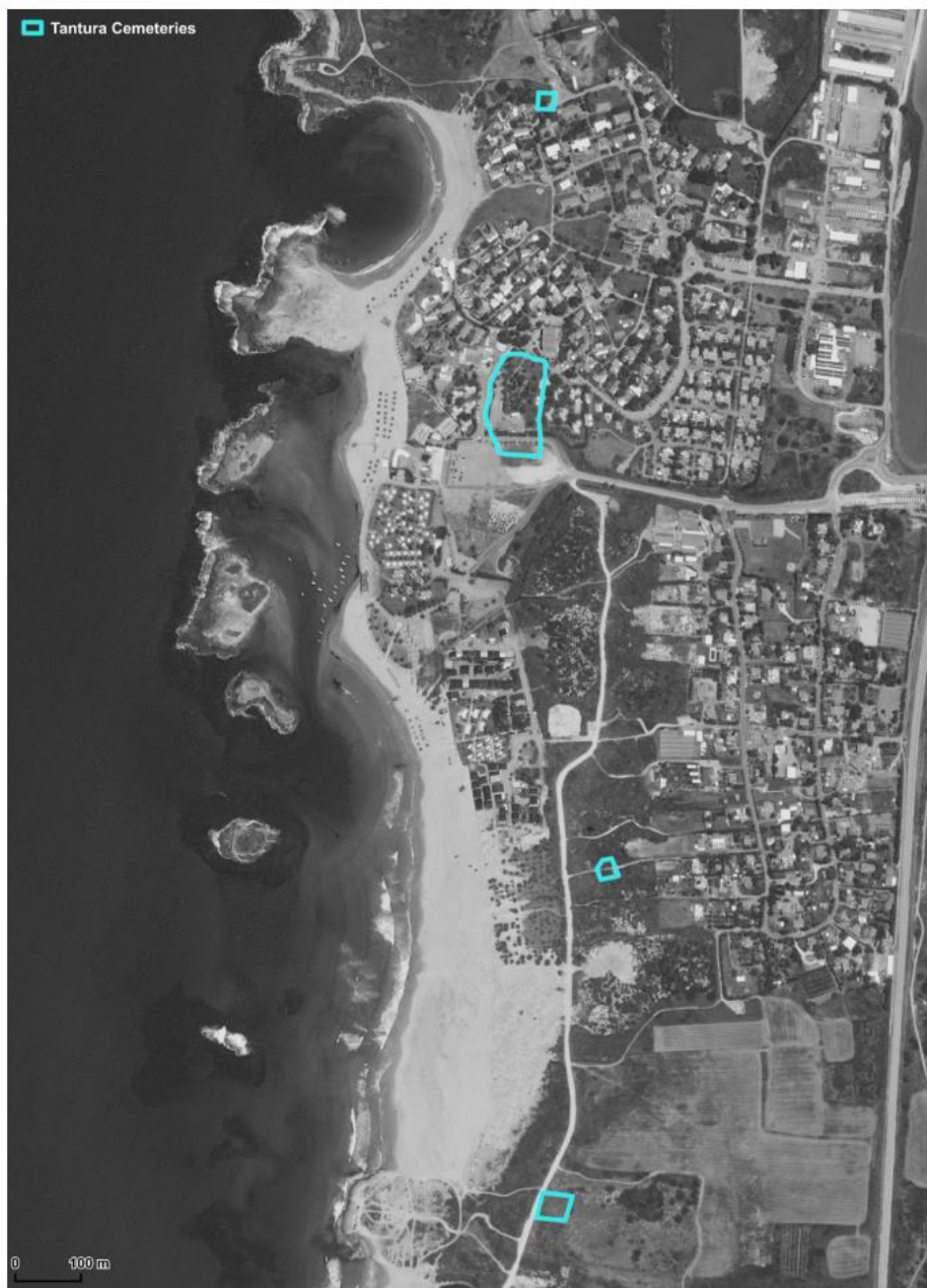
Figure 23. Location of original cemeteries of Tantara overlaid on contemporary satellite image of the village.

קברות נוצרי בחלקו הדרומי של הכפר (32.60551, 34.92041). ארבעת בתי הקברות סומנו בתצלום אוויר להלן: