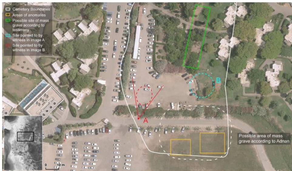
Figure 51. Diagram representing all locations testified to be sites of mass graves inside the cemetery.