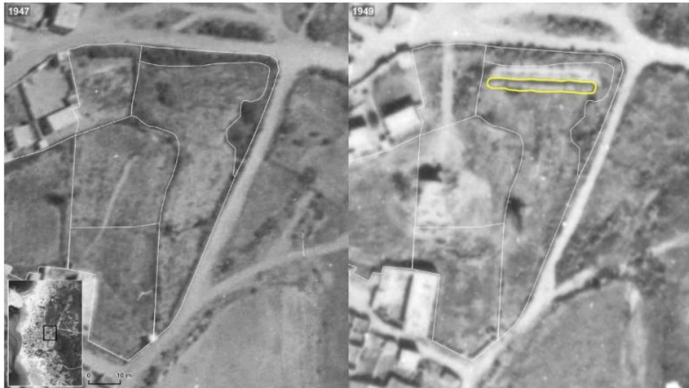
Figure 25. Comparison of the site of E1 between 1947 and 1949 marking the bush and plot lines. Forensic Architecture, 2023.

מקור : FA, דו"ח Executions and Mass Graves in Tantara, בעמ' 32.