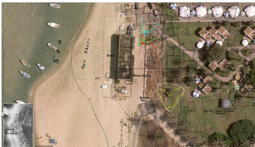
Figure 47. Sites of possible graves near the beach. The blue and red markers indicate al-Masry's testimony. The green marker indicates Hassadieh's testimony in Tantura. The yellow outline represents a mound that appears

כיום, השטח הוא פתוח ומעליו עפר, סלעיות ועשב.